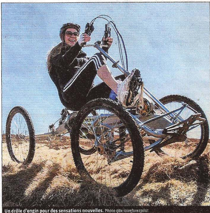
Un rôle d'engin pour des sensations nouvelles.