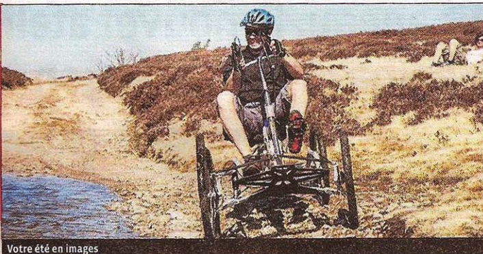
Votre été en images